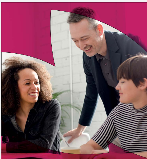
Bildrahmen mit Farbfiltern

Die farbigen Rahmen sollten verwendet werden, um die Hauptpersonen des Bildes hervorzuheben. Es gibt vier Typen von Rahmen-Layouts. Diese können jedoch an die Personen auf dem Bild angepasst werden, solange die Blütenblattform intakt bleibt, wie unten dargestellt.