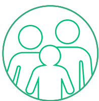
GIOVANI STUDENTI E GENITORI